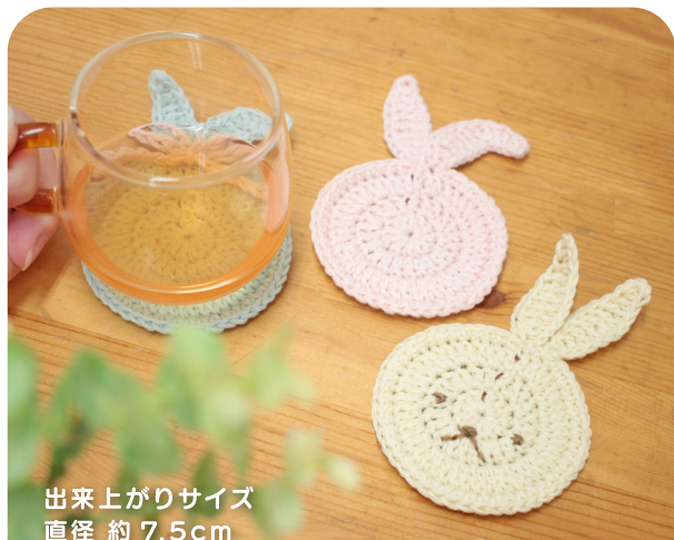
出来上がりサイズ 直径 約 7.5cm (耳含まず)

毛糸の太さや かぎ針の号数で 出来上がりサイズが 異なります。 色々試してみてね♪